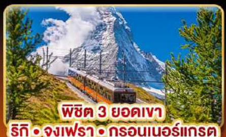
พีชิต 3 ยอดเขา รีทึ • จุงเฟรา • กรอนเนอร์แกรด