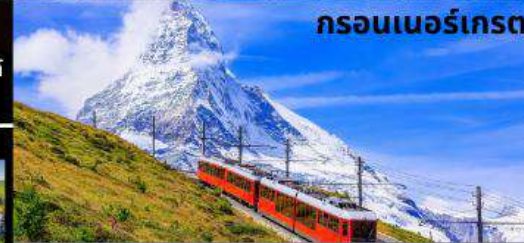
กรอนเนอร์เกรต