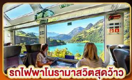
รถไฟพามาสุดสุดจ้าว

📅 เดินทาง 14- 21 เม.ย. | 09-16 พ.ค. | 30-06 มิ.ย. 68