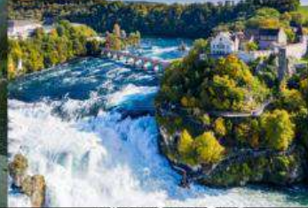
เขื่อนน้ำตกโรน