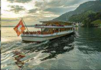
ล่องเรือชมวิวกะเลสาบลูเซิร์น