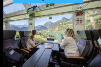
รถไฟ Panarama วิวดูทิวทัศน์